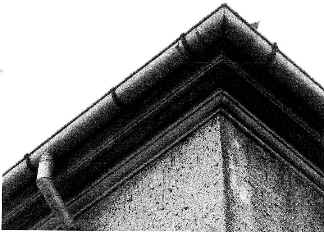
Fot.4. Narożnik pd-zach.