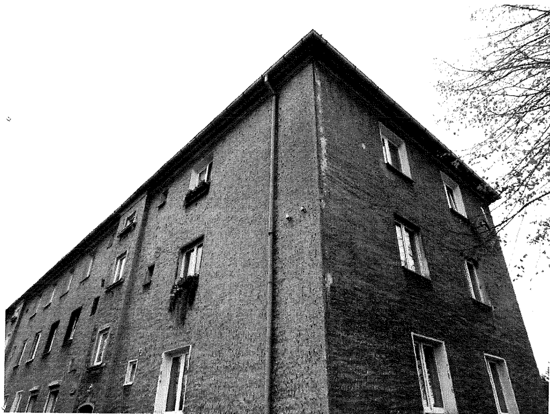
Fot.3. Widok od pd-zach.