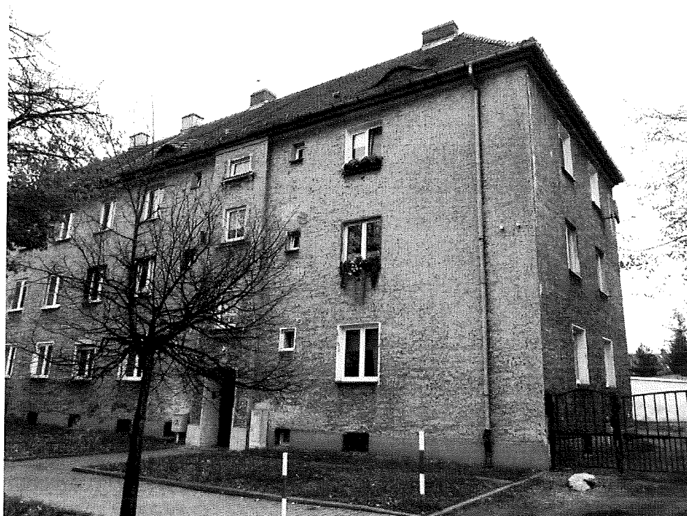
Fot.1. Widok od pd-zach (aut. Szymon Wójcik).