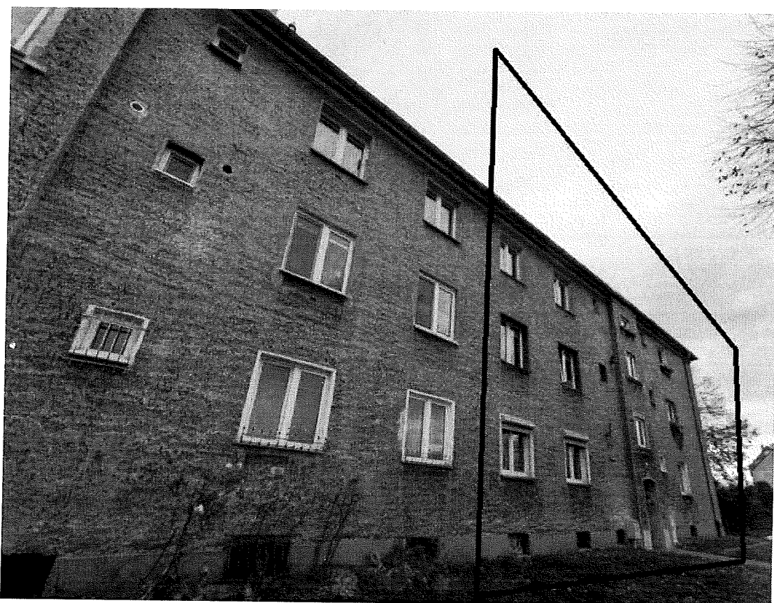
Fot.5. Oznaczono ścianę zachodnią budynku.