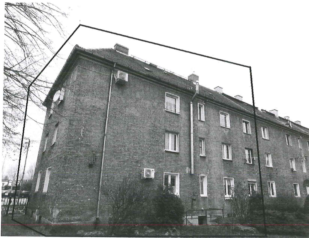
Fot.6. Ściana wschodnia.

Simprint Sp. z o.o. Al. Tadeusza Kościuszki 80/82 lok. 301 90-437 Łódź NIP: 725 224 16 52 simprint@onet.pl Kom. 609 888 003