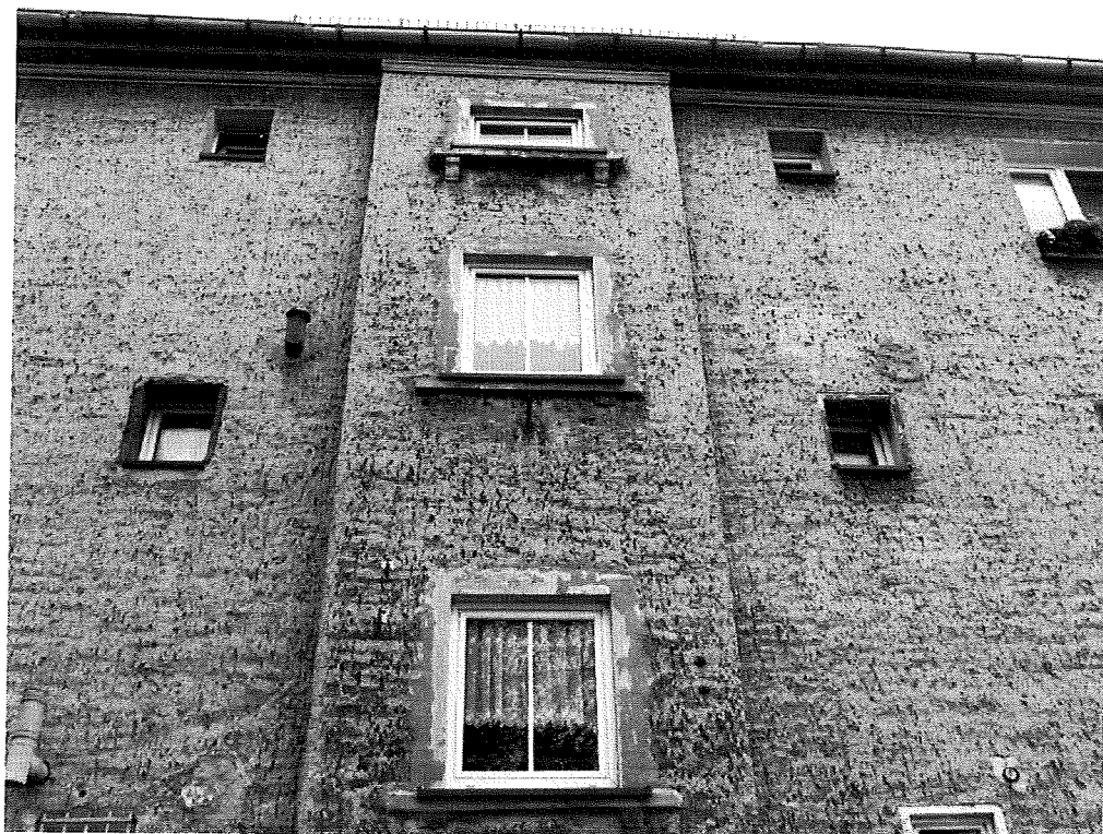
Fot.2. Ściana zachodnia.